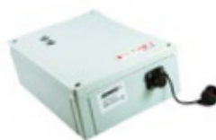
1 Antenne BOX