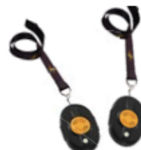
2 Badges Compagnons